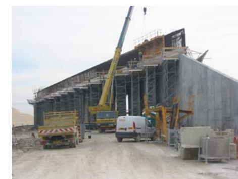
Lot 23A - VIA 23A265