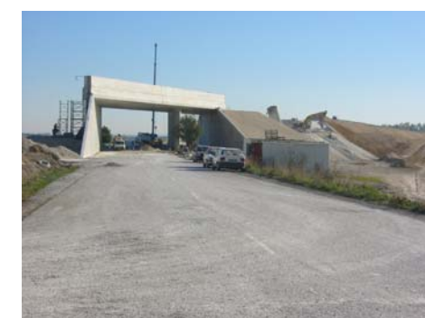
Lot 23B - VIA 23B300