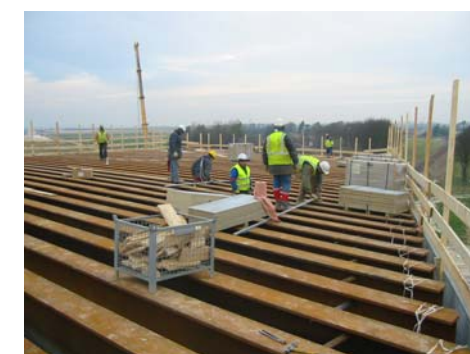
Lot 23B - PRA 23B110