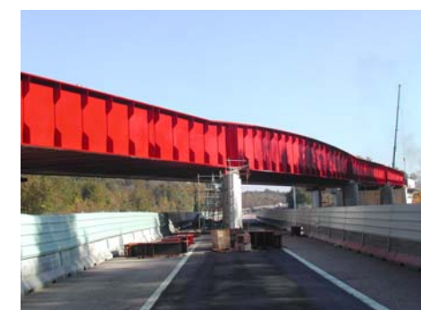
Lot 13 - Viaduc d'Orxois