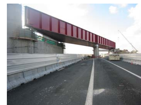
Lot 23B - VIA 23B245