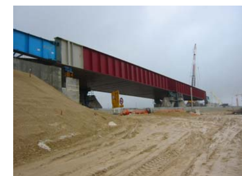
Lot 23A - VIA 23A255